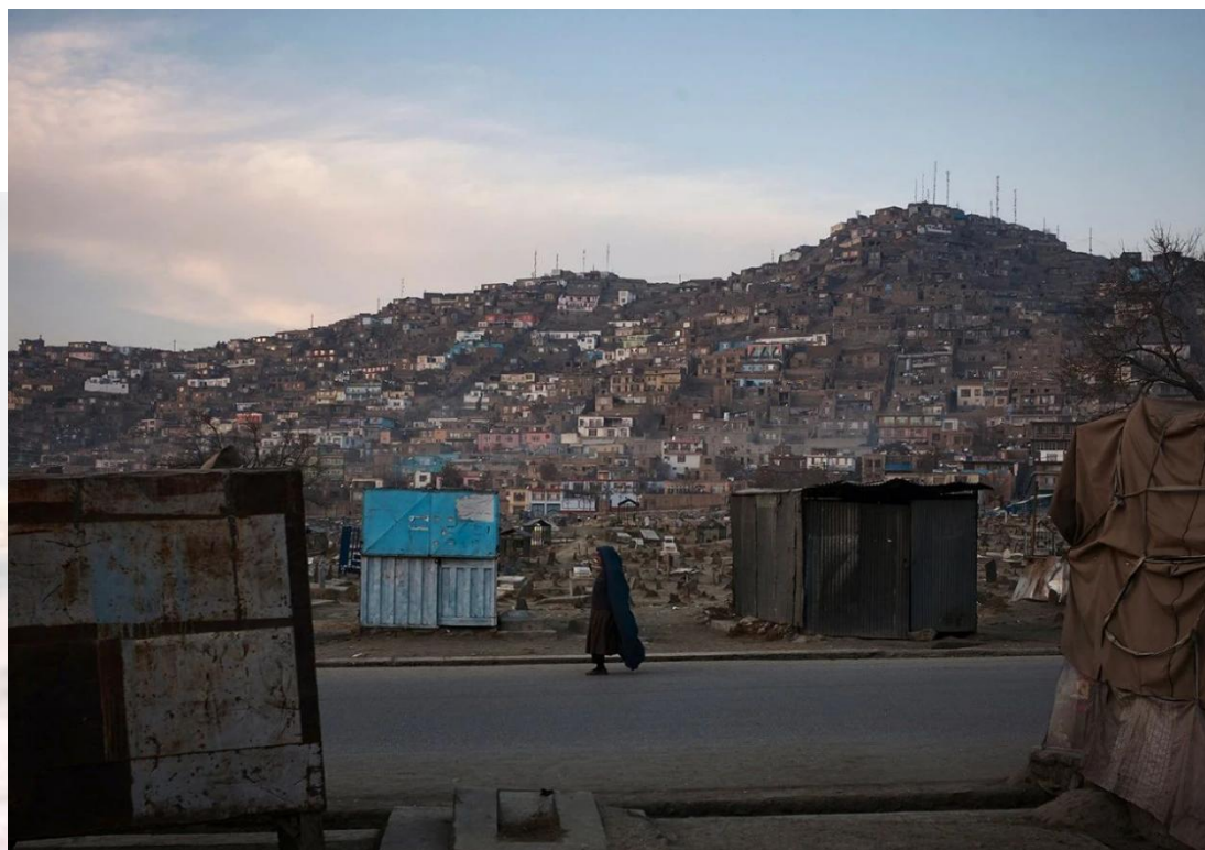
图 10. 身披布卡的阿富汗女性