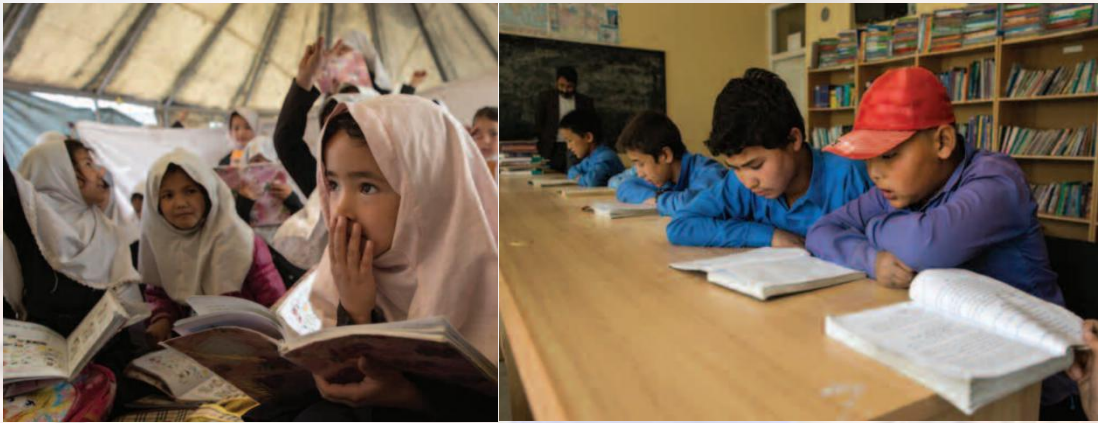
图 4. 比起男生，阿富汗女孩更愿意在帐篷中读书

组织统计研究所，2020）。2016年1月，联合国儿童基金会 (UNICEF) 估计，阿富汗所有学龄儿童中有 40% 没有上学。而根据人权观察的数据，在阿富汗，只有 37% 的女孩识字，而男孩的这一比例为 66%；成年女性中仅有 19% 识字，而成年男性识字率为 49%（人权观察，2017）。