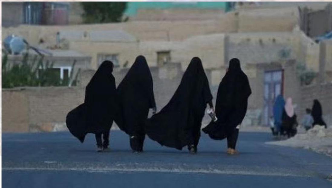
图1. 身着布卡的阿富汗女性

随着政权更迭，阿富汗国内局势动荡。塔利班表示希望进行“和平”政权交接，并承诺尊重阿富汗女性权利。在夺取阿富汗政权后的第一次新闻发布会上，发言人苏梅尔·沙欣（Suhail Shaheen）公开表示，在塔利班掌权后，阿富汗女性不会被剥夺工作机会和受教育机会，女性可以继续工作，但要戴面纱。换句话说，塔利班保证阿富汗女性权利将在“伊斯兰教的范围内”得到尊重。