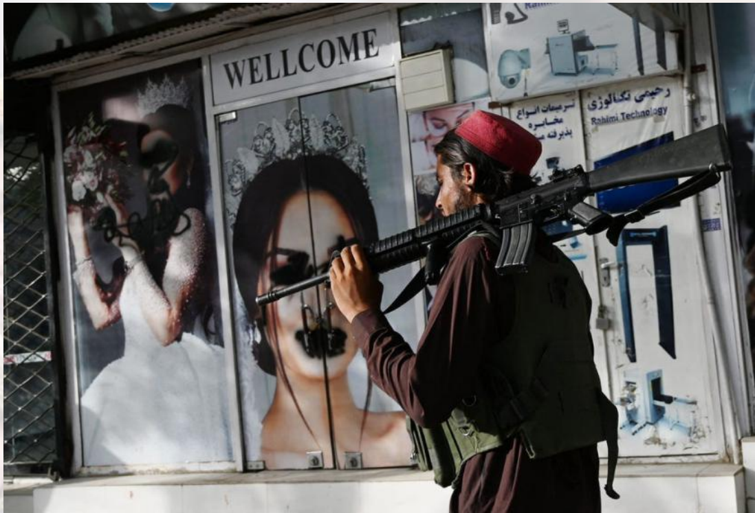
图 3. 持枪塔利班人员经过一家美容院（2020年8月18日）

得阿富汗女性常常因为失去平衡而摔倒，与现代工作环境更是格格不入。总之，受教育权利缺乏使她们难以获得足够的就业知识培训，不能在劳动力市场获得足够的竞争力，持续的家庭工作又关闭了她们重回就业市场的路径。这样的认识轨迹在一代代底层阿富汗妇女中延续，她们长期付出的家庭劳动不被认可，并在劳动力市场饱受歧视。