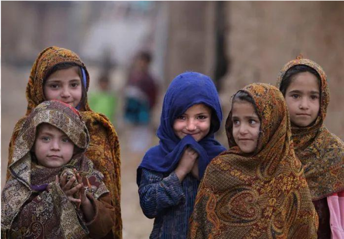
图2. 向镜头微笑的阿富汗女孩

中——无论其宗派属性如何，女性都被鼓励追求其精神抱负，积极就业、求学（JAKES, 2021）。但上世纪90年代，塔利班执政后，当地女性地位一落千丈（薛晶，2021）。即便在2020年的前阿富汗塔利班根据地——赫尔曼德省，塔利班也曾禁止女性接受教育或从事工作，反对女性进入安全部队或在政府机关工作（邹德路，2020）。