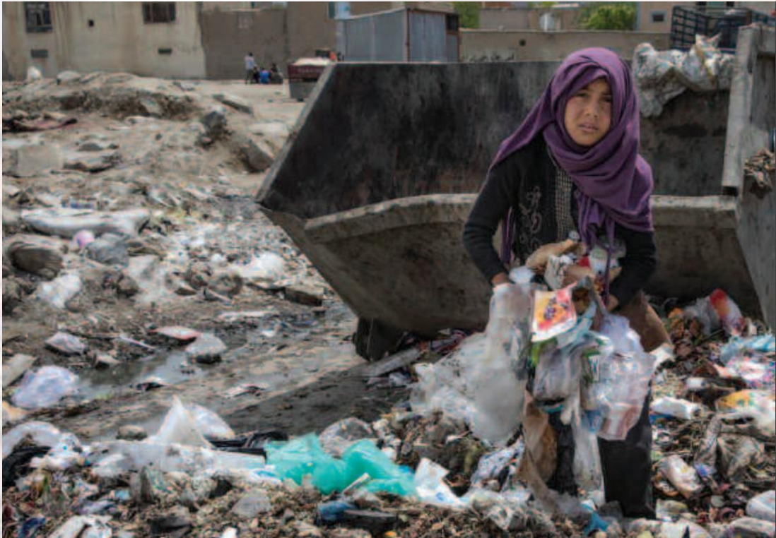
图 6. 一名以捡垃圾为生的阿富汗妇女

女孩在贫穷家境中的处境往往比男孩更差。当贫穷家庭只能支持家庭中的一个小孩上学时，阿富汗父母往往会选择男孩。此外，经济原因也是很重要的一部分。阿富汗女孩往往在结婚后就会脱离家庭，为她丈夫的家庭作出贡献，而男孩却需要继续供养父母。考虑到教育机会是家庭决策的结果，父母往往认为让男孩去读书是一种“更为明智”的投资。