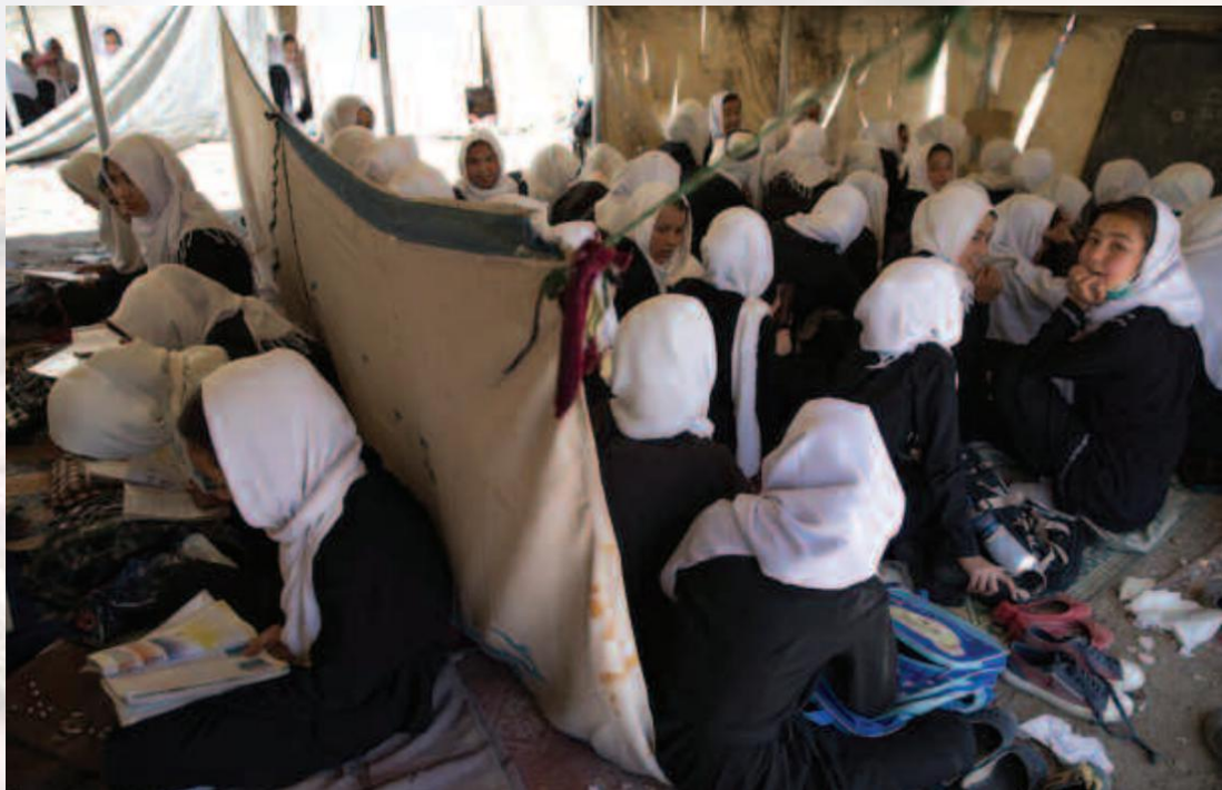
图 5. 正在学习的阿富汗少女

在师资方面，不少学校面临轮班时间短、人员配备少、工资低以及不安全等因素。阿富汗教师的月薪通常低于 100 美元。教师（尤其是女教师）短缺且下乡困难。阿富汗 34 个省中有 7 个省的女教师人数占比不到 10%，有 17 个省不到 20%。女教师数量的短缺导致很多女孩无法上学，因为她们的家人往往不接受由男老师负责教书。