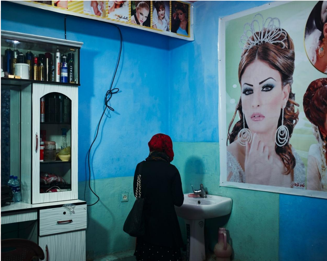
图 8. 阿富汗的一处女性美容院

多达 28 万亿美元，即上升 26%。因此，将女性长期排除在劳动力市场外的做法，不仅是对女性个体权利的剥削，更对国家经济整体发展有害无利。