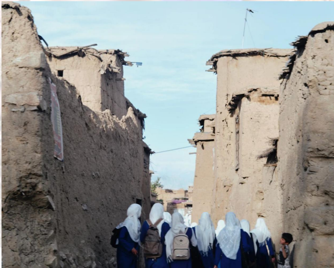
图9. 刚刚放学的阿富汗女学生

Amowitz等（2003）认为，在塔利班统治下的阿富汗，限制妇女权利的政策不是传统观念、社会和经济剥夺的产物；相反，这是人为制定的政策，容易